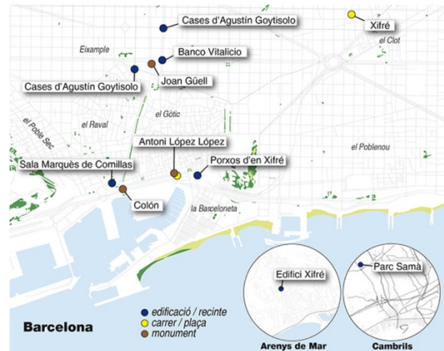
Figura 2. Mapa amb la ubicació de diversos monuments, carrers i sales que duen nom de negrers